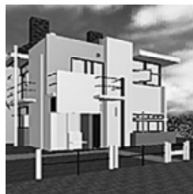
Casa Schroder – Gerrit Rietveld