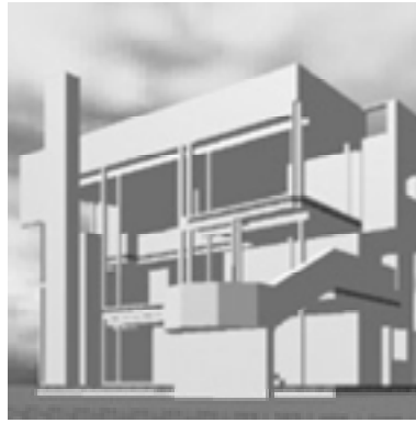
Casa Smith – Richard Meier