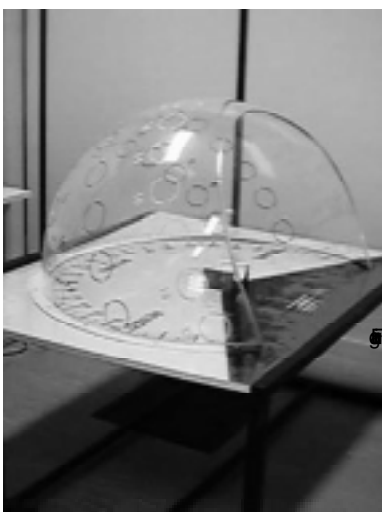
Heliodon em uso no Curso de Arquitetura e Urbanismo - UNISINOS

tecnologia nova, qualificar melhor os profissionais arquitetos. Para os estudantes de arquitetura, a nova tecnologia, estudada e adaptada, poderá despertar maior aprofundamento nas propostas bem como maior interesse na solução ambiental. Desta forma poderá haver um ganho social relativo a melhor qualidade do ambiente construído. O projeto dá continuidade ao projeto de construção de equipamento de avaliação das edificações com preocupações com o conforto ambiental (Automação do sistema de simulação do movimento aparente do sol – “heliodon”). O “novo” heliodon” terá controle computadorizado, com acesso a um banco de dados que informará, em nível preliminar, as condições ambientais de um determinado sítio. Este exame fornecerá informações para a formulação de hipóteses de trabalho que poderão ser conferidas com o uso de maquetes, durante as diversas etapas de desenvolvimento.