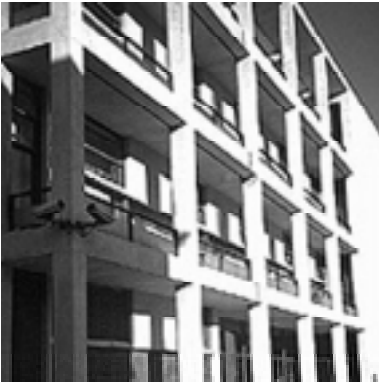
Casa Del Fascio – Giuseppe Terragni