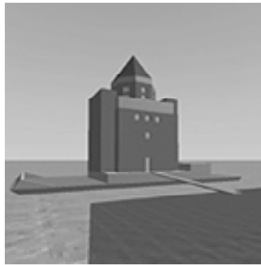
Teatro Del Mondo – Aldo Rossi

Dentre os edifícios listados na tabela, foi possível identificar os edifícios das figuras 4 a 9 como potenciais edifícios para serem construídos os modelos. Na verdade, estes edifícios estão sob exame, para que seja possível formar um nexos, arquitetônico e de conforto, que justifique sua escolha.