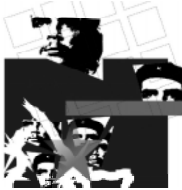
Fig 3: Che/ graffitis de la selva