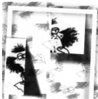
Fig 6: Historieta argentina / Inodoro Pereyra