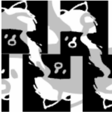
Fig 2: Historieta argentina / Mafalda