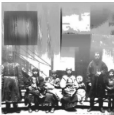
Fig 5: Inmigrantes/ Paisaje pampeano

allá del producto único. Las ideas que a partir de su uso han sido generadas en este seminario, se encuentran en vías de iniciar una segunda etapa, de complejización, de entrecruzamiento de trabajos individuales con el objetivo de abordar grados de innovación aún mayores, no sólo en términos de diseño, sino, además, en términos de didáctica, fundamento central de este seminario.