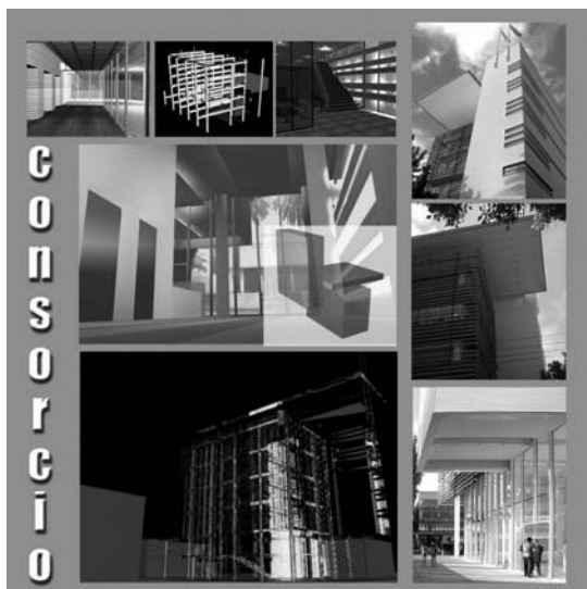
Figura 1. Modelos Digitales y Vistas del Edificio Consortio de Concepción (E. Browne).

Para la experimentación práctica de este estudio se visitaron una veintena de obras destacadas de arquitectura contemporánea en el sur de Chile, seleccionando finalmente dos edificios (Consortio de Concepción y Paneles Arauco) que han recibido distinciones y publicaciones, y sus autores han expresado una particular postura teórica.