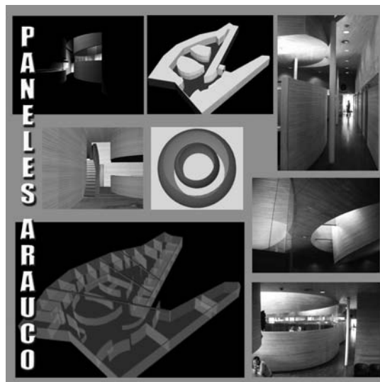
Figura 2. Modelos Digitales y Vistas de Oficinas Paneles Arauco (J. Cruz Ovalle).

En la visita al edificio destaca su gran altura respecto al entorno y en particular la esquina, las novedosa articulación de las formas, el uso de materiales nuevos y bien mantenidos, con una curva vidriada en primer nivel, un gran techo en voladizo y fachadas con entramado (escasamente se distingue vegetación). Los espacios de ingreso son elegantes y luminosos, y las oficinas interiores compuestas de divisiones vidriadas bastante atestadas. La circulación a los pisos superiores se realiza por ascensores cerrados con acceso restringido. La obra es valorada profesionalmente por su composición dinámica, tratamiento cuidadoso de los detalles y materiales, incluyendo entradas de luz y protección de las fachadas, constituyéndose indudablemente en un edificio destacado en la ciudad.