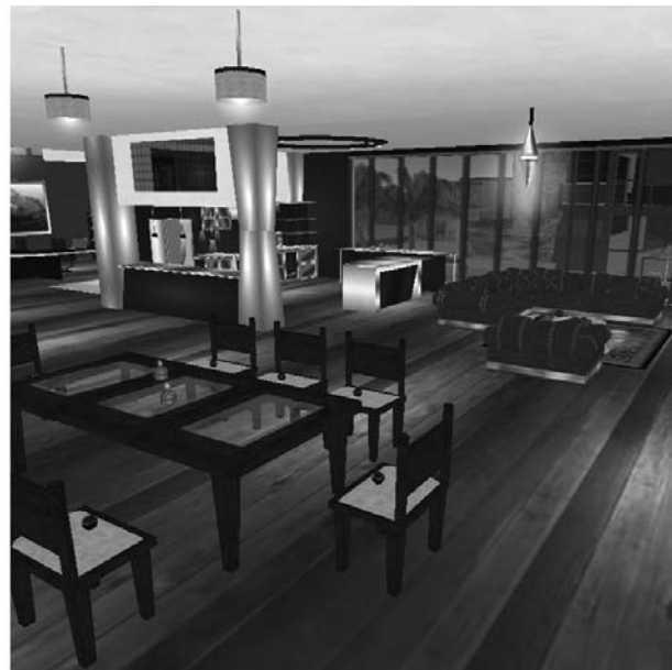
Figura 1 Arquitectura en Second Life