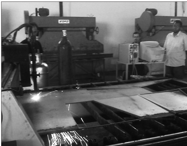
Figura 5. Corte em CNC (Mega Forte, Brasília).