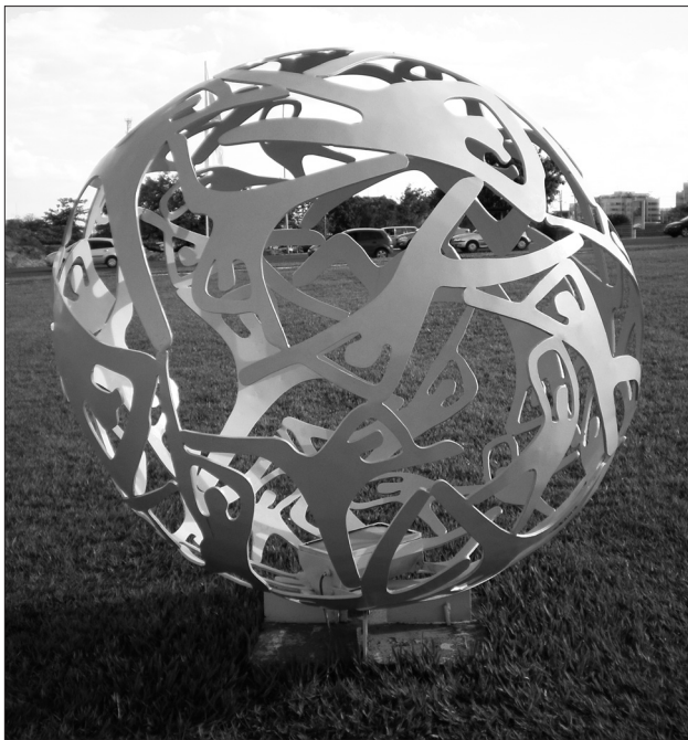
Figura 6. Escultura do artista Darlan Rosa executada em CNC por Ferro e Aço Badaruco, Brasília