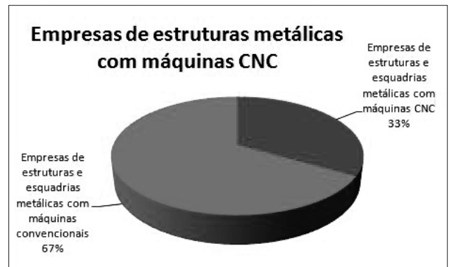
Figura 3. Empresas de estruturas metálicas utilizando CNC.

do corte bidimensional, mas com um percentual significativo de máquinas CNC de conformação (dobra e estamparia).