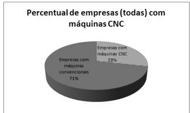
Figura 2. Percentual de empresas utilizando CNC.