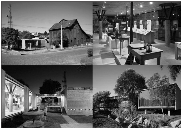
Fig. 2. Museo del Pan, Ilopolis (Brasil Arquitetura)

la plaza de la reducción y se ofrece un espectáculo de luz y sonido. La integración con otras alternativas turísticas de la región, como el tren Maria Fumaça y el Valle de los Viñedos acontece y es estimulada por las agencias del turismo (Oltamari y Borghetti, 2005).