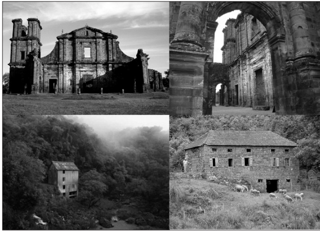
Fig. 1. Rutas Patrimoniales (Misiones, Caminos de Molinos, Caminos de Piedra)