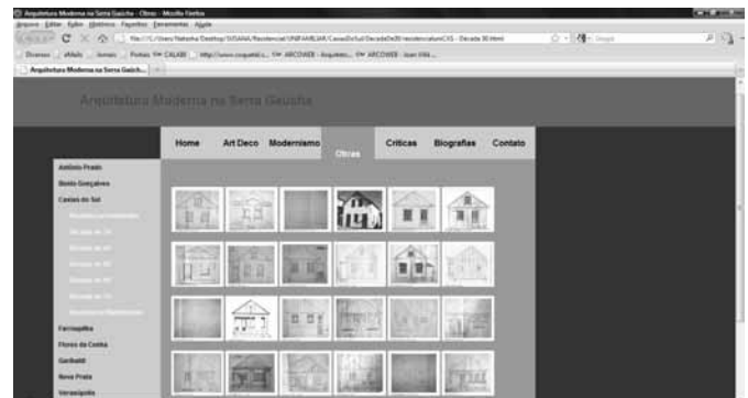
Figura 2. Layout da página “Obras”

Os textos biográficos podem ser visualizados selecionando na barra de percurso principal da página a opção “Biografias”. O usuário é direcionado a uma página com os nomes dos arquitetos, listados na barra de percurso secundária, localizada no lado esquerdo da página. Clicando sobre o nome, é aberta a página com a referida biografia (Fig. 4).