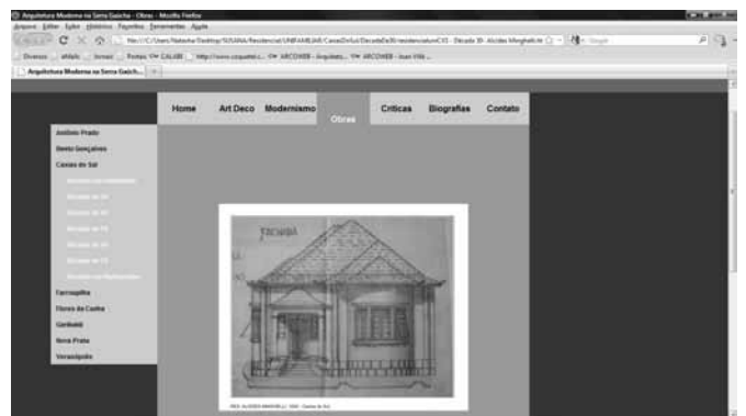
Figura 3. Layout da página “obras”: ampliação da imagem documentada