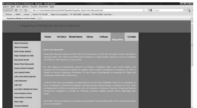
Figura 4. Layout da página “Biografias”