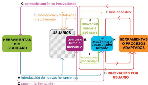
Diagrama 2. Diagrama de flujo de la innovación por el usuario en BIM que resulta de superponer los diagramas de cada uno de los casos estudiados.

Se puede discutir que la aparición de un tercer agente invalida estos casos como reales innovaciones por el usuario , pero se incluyen dentro del estudio ya que en muchos casos su distribución gratuita permite satisfacer las necesidades de una gran cantidad de usuarios que no tiene los medios para innovar, permitiéndoles superar la complejidad de adaptación que presentan las herramientas BIM. Esto demuestra que si bien existe innovación por el usuario en el caso de BIM aún existe espacio de mejoras.