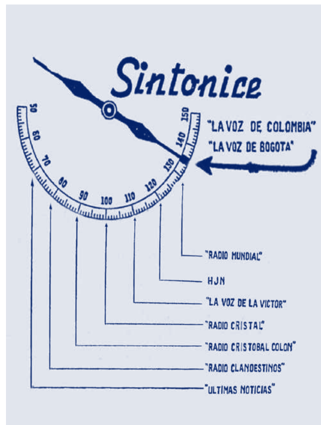
Imagen 4: Afiche con los nombres de las emisoras.