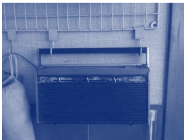
Imagen 2 :Fotografía del radio original Philips holandés.

El proceso creativo tuvo 3 fases que conformaron la metodología del proyecto: