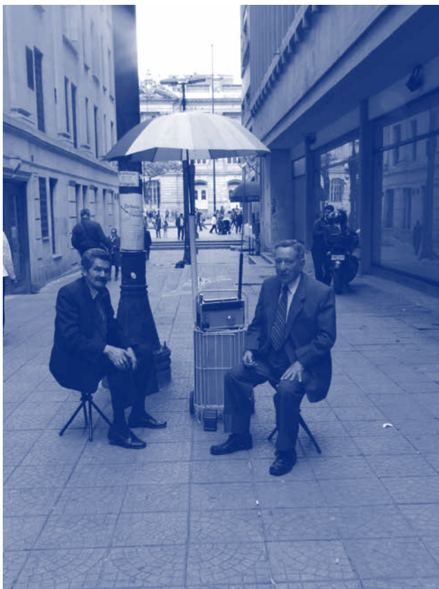
Imagen 3 : Fotografía Philips holandés Calle 14 debajo de la 7ma.