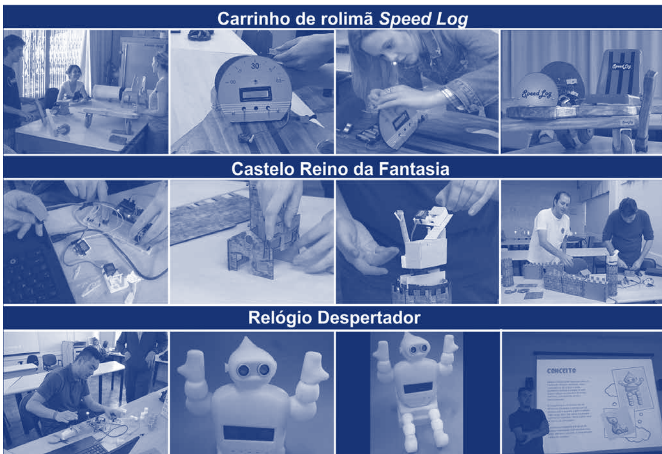
Figura 3: Produtos desenvolvidos

O carrinho de rolimã é um produto inspirado em brincadeira em grupo e ao ar livre. Os requisitos do projeto foram: interativo-responsivo o usuário poderia ver o registro de velocidade e filmar suas ações, estilo retrô, material madeira, display, suportar até 70kg. A (Figura 3) mostra a equipe montando o protótipo e realizando as conexões elétricas do painel. O carrinho de rolimã combina o resgate de valores antigos, focado no tema retrô, com a tecnologia atual. A proposta envolve liberdade e socialização para a nova geração, por meio de um brinquedo para o público infantil, com abordagem na inovação e tecnologia.