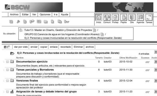
Figura 2: Carpeta de un equipo (Recuperada el 17 de febrero de 2016 de http://bscw.ing.udep.edu.pe/bscw/bscw.cgi/9854266 )

El producto final, los productos intermedios y el proceso deben ser evaluados.