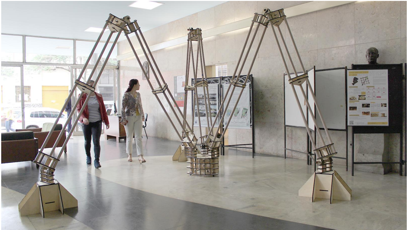
Figura 1: Vista da estrutura da interface sem sensores e atuadores acoplados.

contínuo os usuários podem eventualmente desenvolver significados para essas ações. E, se levado ao limite, os usuários podem significar tais ações de forma colaborativa,