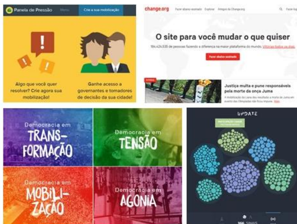
Figura 2: Dispositivos de participação.

A terceira e última tipologia de dispositivo, os Dispositivos Didáticos e de Pesquisa, assemelha-se a tipologia Dispositivos de Informação, porém, inserindo mecanismos de interatividade e permitindo análises, comparações e configurações na exibição dos dados. Muitas vezes criados através da associação de empresas e instituições particulares, esses dispositivos, embora também objetivem o compartilhamento de informações para empoderar os cidadãos, também possuem uma preocupação didática e de pesquisa. Além de fornecer dados para o usuário, esses portais também oferecem mecanismos interativos de organização e análise desses dados, adicionando mais complexidade na construção de cenários e no agrupamento de informações.