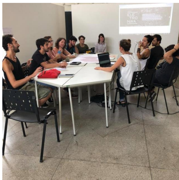
Figura 3: Rodada de apresentação da ferramenta no workshop Cidade Eletrônica.

Uma primeira experiência de teste do protótipo de prova (Figura 3), foi conduzida em janeiro de 2018, durante um workshop no evento Cidade Eletrônica, em Belo Horizonte, cujos resultados serão de grande valia para as etapas subsequentes do projeto. O workshop ocorreu durante dois dias, com a participação de 10 inscritos – em sua maioria, estudantes de arquitetura e urbanismo de várias localidades do Brasil –, tendo como tema o bairro de Santa Tereza e as transformações a que seu território vem sendo submetido.