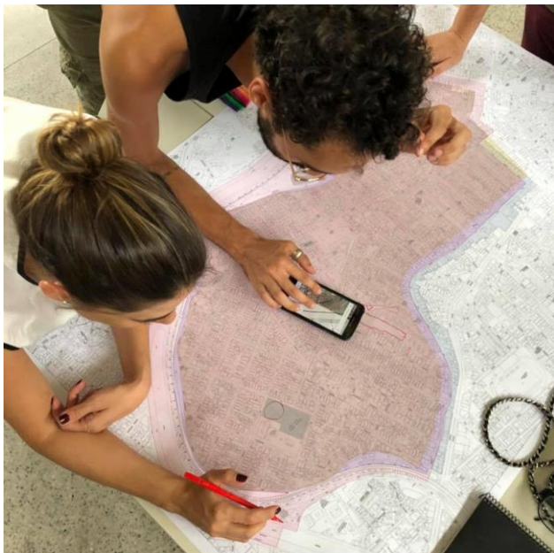
Figura 5: Processo analógico para auxiliar o processo de coleta de informações no trabalho da equipe.

Como será discutido na seção de comentários finais, o número de participantes e a composição dos grupos foram muito diferentes do que esperávamos - já que tínhamos planejado trabalhar principalmente com grupos mais envolvidos com a área de estudo, o que deveria simplificar os momentos de coleta de dados e permitir mais tempo para os processos de se familiarizar com a plataforma e de produzir as visualizações.