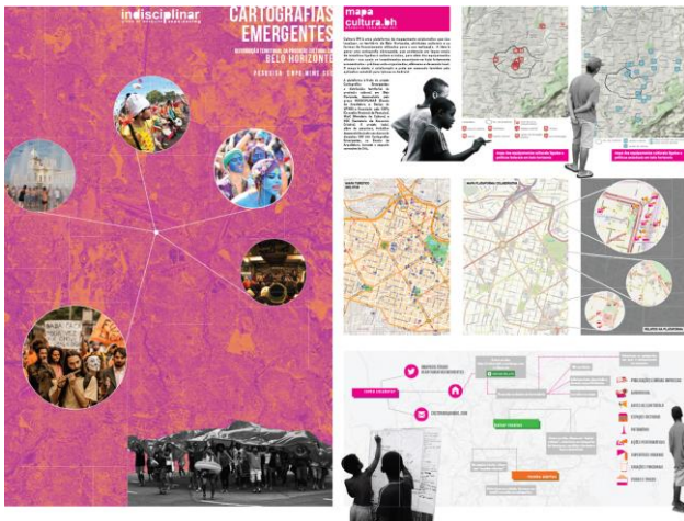
Figura 1: Produção de infográficos do Indisciplinar.

O grupo já vem produzindo uma série de análises similares ao que propõe com a plataforma, sob a definição de narrativa cartográfica, mas ainda não conta com uma ferramenta única capaz de relacionar e sobrepor os dados de seus principais eixos de investigação (territorial, temporal, social e comunicacional). Pretende-se, ademais, promover a integração entre as coletas de dados espaciais feitas tanto por pesquisadores quanto por cidadãos comuns, incluindo os usuários dos espaços investigados como protagonistas da produção de conhecimento. Dessa forma, são estabelecidos vários canais de comunicação entre os diversos atores envolvidos na produção e na gestão das cidades.